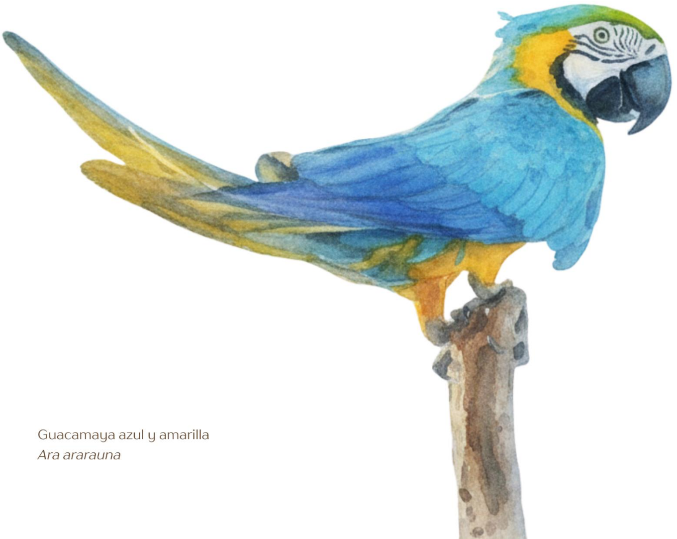
Guacamaya azul y amarilla Ara ararauna