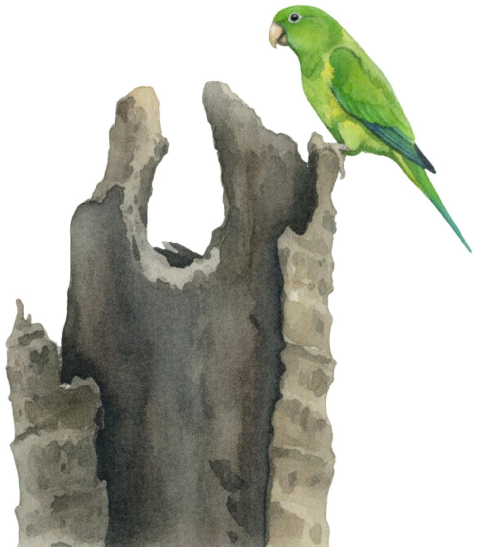
Perico alibronceado Brotogeris jugularis