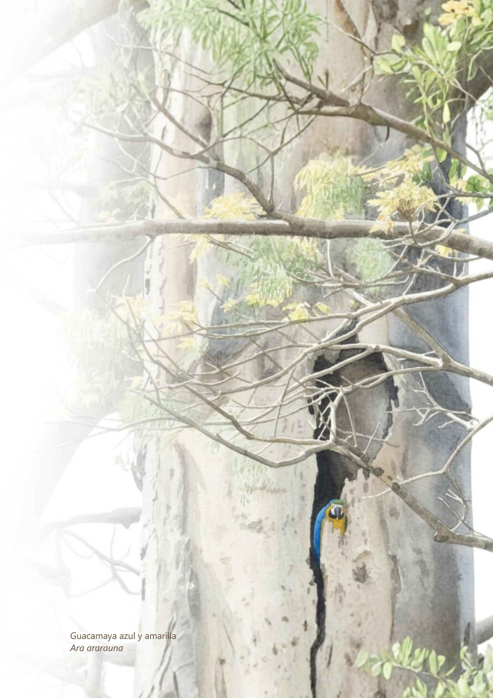
Guacamaya azul y amarilla Ara ararauna